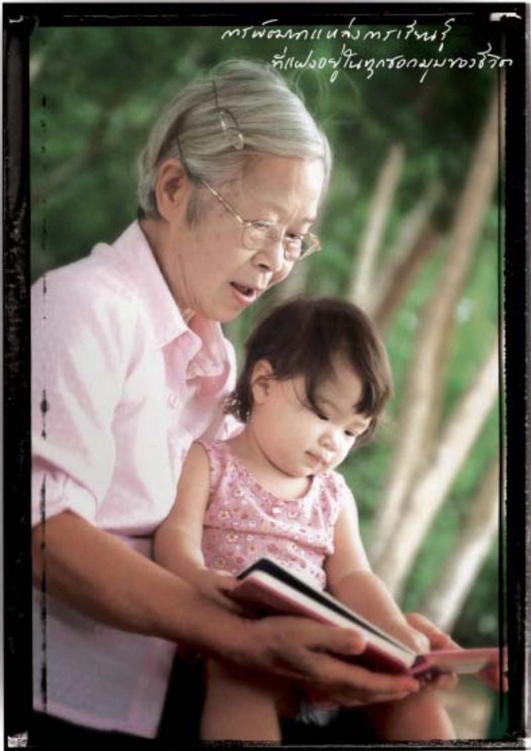
The development of learning sources concealed in every corner of life.