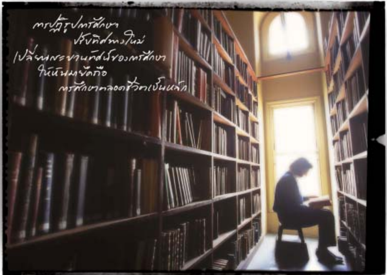
Education reform undertaken has changed a new direction of educational paradigm to lifelong learning as a principle.