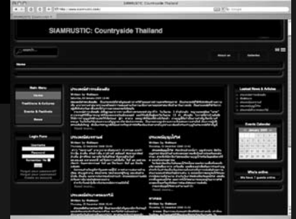
www.siamrustic.com Countryside Thailand รักษ์ชนบทแห่งประเทศไทย

With a good intention of greenmarket activities organizer in becoming a middleman between producers and consumers of green products, the organizer uses the website as a channel to promote various activities e.g. weekly discussion, workshop, organic farming of producers, demonstration of food cooking for health and occupational training for novice green entrepreneurs. The website allows those interested to participate in pursuing the concept of sustainable consumption and helping making green consumers network.