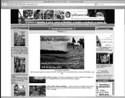
www.sathai.org มูลนิธิเกษตรกรรมยั่งยืน (ประเทศไทย)

เกษตรกรรมยั่งยืน คือ กระบวนการผลิตที่เกษตรกรเป็นหลักในการพัฒนาด้วยการนำทรัพยากรในท้องถิ่นมาใช้อย่างเหมาะสม ถือเป็น การสร้างมูลค่าเพิ่มให้ที่ดินและทำให้พึ่งพาตนเองได้ในระยะยาว มูลนิธิเกษตรกรรมยั่งยืนจึงทำหน้าที่เป็นสื่อกลางในการรวบรวมองค์ความรู้การนำภูมิปัญญา มาปรับใช้ รวมไปถึงคิดค้นทางออกใหม่ๆ ให้สอดคล้องกับการแก้ไขปัญหา สร้างเกษตรกรและชุมชนให้มีคุณภาพชีวิตที่ดีขึ้น มีอุดมการณ์ในการพึ่งพาตนเอง และนำไปสู่ความเกื้อกูลกันในชุมชนท้องถิ่น