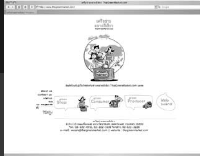
www.thaigreenmarket.com เครือข่ายตลาดสีเขียว

Sustainable Agriculture is the production process in which the farmers play a major role. With the appropriate use of local resources, the process adds value of the land and enables the farmers to be self reliant in the long term. Sustainable Agriculture Foundation is a platform of collecting knowledge base, application of wisdom and seeking new solutions for the problems. Also, the foundation helps improve the quality of lives of farmers and communities and support ideology in self reliance which will lead to hospitality in local community.